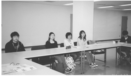
第9回 スプリング・カレッジ

した学生たちと宗教部の先生たちや職員たちが一緒に礼拝をし、自己紹介や親睦、短い学びの時をもちます。 本学の建学の精神であるキリスト教について理解を深め、また学内の宗教活動の紹介などもします。