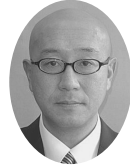
長 博 副 部長 宗 教 部 北

新入生諸君、入学おめでとう！東北学院大学は君達を心から歓迎します。勉学に、スポーツに、その他の様々な活動に、学内に豊富にある施設やサークルを存分に利用して、充実したキャンパスライフを楽しんで下さい。それから三年生に進級される諸君は、今までの泉キャンパスでの生活から心