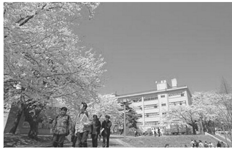
多賀城キャンパス