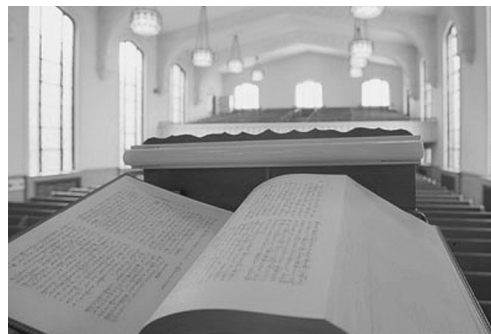
土樋キャンパス礼拝堂

もとの言葉は、ロギケー・ラトレイア、英訳聖書が訳しているように reasonable service 的 私たちが大学の礼拝は、反理性的・非理性的な礼拝であ