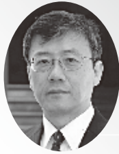
宗教部長 佐々木 哲夫