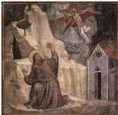
ジョット『聖痕を受ける聖フランチェスコ』、1300年頃、パリ、ルーブル美術館