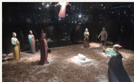
ロンドン、トラファルガー広場の降誕人形(クリッペ)