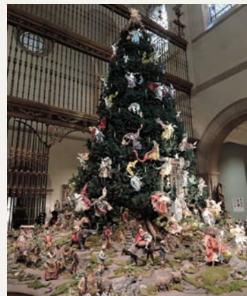
ニューヨーク、メトロポリタン美術館のクリスマスツリーと降誕人形(クリッペ)